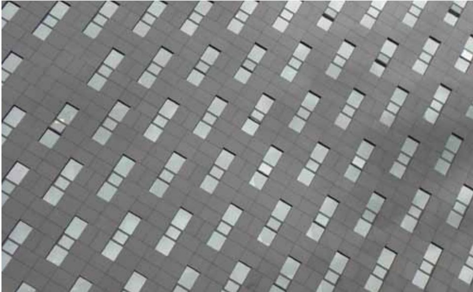
Generalinė prokuratūra – patikimas valstybinio nusikalstamo pasaulio buferis.

Po to, kai Generalinė prokuratūra eilini kartą pripažino bendradarbiaujanti su nusikalstamomis struktūromis, nutraukdama ikiteisminį tyrimą dėl VEKS internetinių portalų, per kuriuos ilgą laiką pavogė apvalią pinigų sumą, ekspertai.eu kreipėsi į Seimo Antikorupcijos komisijos narę Aureliją Stancikienę, prašydami pakomentuoti šią situaciją.