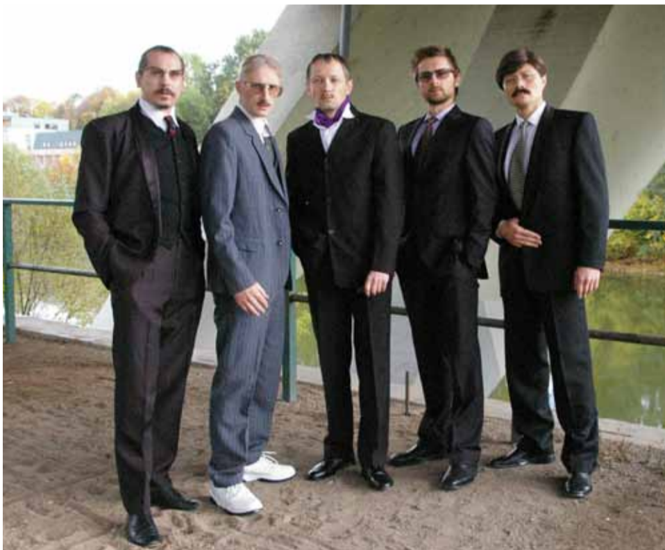
Ekspertai.eu laiukia Generalinio prokuroro atsakymo.