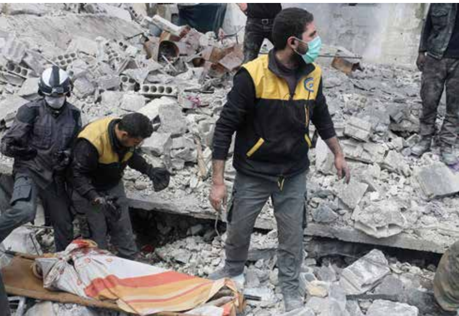
Gelbėjimo darbai Gutoje, Damaskas, Sirija.

2017 m. tęsėsi ISIL nuosmukis Sirijoje ir Irake. Jos kontroliuotas teritorijas Sirijoje puolė tiek vietos kurdų kovotojai, palaikomi JAV, tiek režimo pajėgos, remiamos Rusijos. Irake su ISIL sėkmingai kovojo Irako saugumo pajėgos ir tarptautinė koalicija, vadovaujama JAV. Džihadistai nepajėgė atsilaikyti ir prarado beveik visas turėtas teritorijas, įskaitant svarbiausius miestus – Raką ir Mosulą. ISIL pseudovalstybė („kalifatas“) buvo sunaikinta, o didžioji dalis grupuotės kovotojų buvo priversti trauktis į pogrindį. Šiuo metu ISIL kontroliuoja tik strategiškai nesvarbius teritorijos likučius Sirijoje ir Irake. Grupuotės kovotojų skaičius šiose valstybėse nesiekia 3 tūkst.