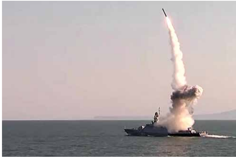
„Kalibr“ sistemos sparnuotosios raketos paleidimas.

2018 m. vasario 5 d. pirmieji „Iskander-M“ kompleksai, keičiantys senesnio modelio raketų sistemas „Točka-U“, atgabenti nuolatiniam dislokavimui į Kaliningrado sritį. Šios raketų sistemos gali naudoti tiek konvencinį, tiek branduolinį užtaisą ir geba naikinti antžeminius taikinius 500 km spinduliu. Jų dislokavimas Kaliningrado srityje išplečia Rusijos galimybes naikinti priešininko karinę ir civilinę kritinę infrastruktūrą, didina atkirtimo ir izoliavimo (toliau – A2 / AD) efektą ir, kilus krizei ar karui, apsunkintų NATO operacijas Baltijos jūros regione.