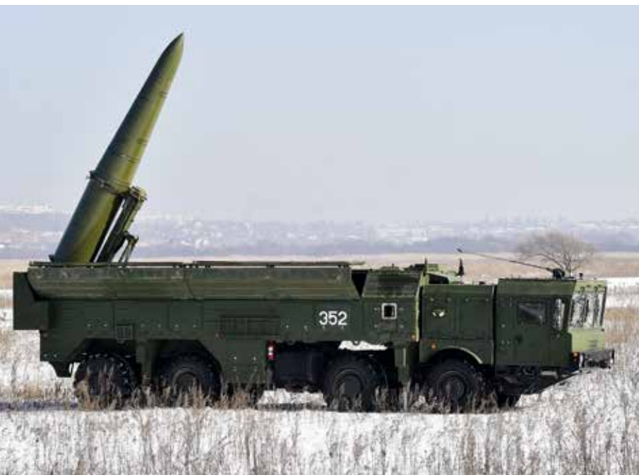
Raketų kompleksas „Iskander-M“.

beveik visas raketų brigadas, 152-oji brigada tapo vienuoliktąja, perginkluota naujais raketų kompleksais. Labai tikėtina, kad dabar, sistemą jau dislokavus Kaliningrado srityje, Rusija tai mėgins pateikti kaip atsaką į tariamai nereikalingą ir kenksmingą NATO aktyvumą regione. Kartu tai yra labai geras pavyzdys, iliustruojantis, kaip Rusija nuoseklų savo GP perginklavimo proceso žingsnį pateikia kaip menamą atsaką NATO.