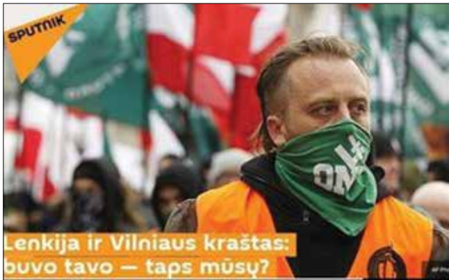
Lenkija ir Vilniaus kraštas: buvo tavo – taps mūsų?