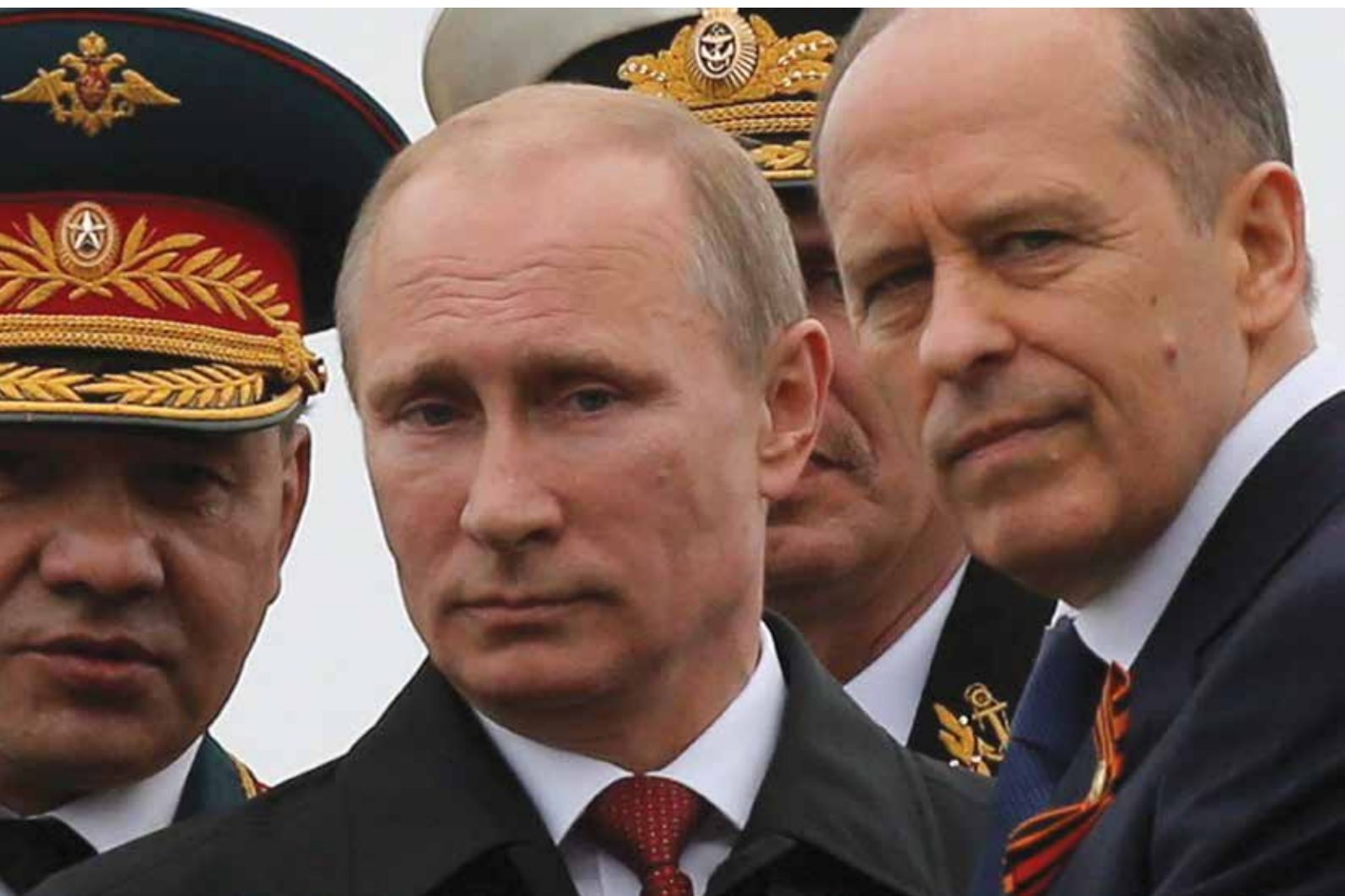
Rusijos prezidentas, gynybos ministras ir FSB direktorius.