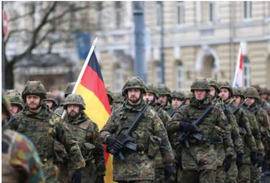
NATO eFP kariai.

2017 m. Rusijos požiūris į Baltijos valstybes išliko priešiškas, o jos politikoje Baltijos regiono atžvilgiu vyravo didėjančių NATO pajėgumų klausimas. Rusija diplomatinėmis ir informacinėmis priemonėmis siekia parodyti, kad Baltijos valstybių ir NATO karinių pajėgumų vystymas didina įtampą ir mažina saugumą Baltijos regione. Karinėmis priemonėmis Rusija rodo, kad ji turi ir bet kuriuo atveju išlaikys karinį dominavimą Baltijos regione, todėl NATO pajėgumų didinimas esą gali sukurti pavojingą įtampos augimo spiralę: į kiekvieną Aljanso veiksmą Rusija atsakys didindama savo pajėgumus ir išlaikys dominavimą regione, o bendra saugumo situacija blogės.