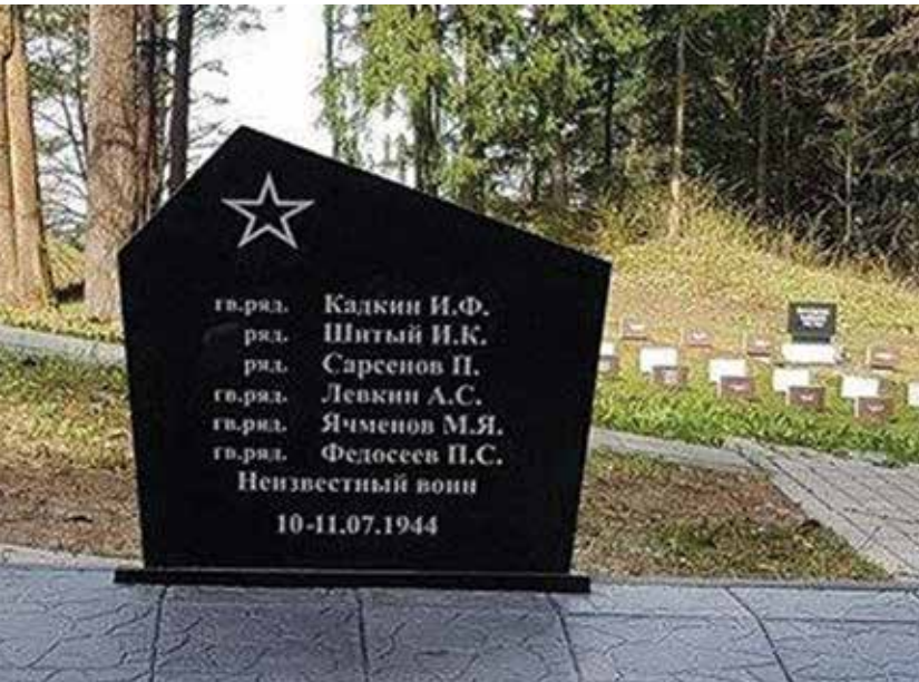
Neteisėtai pastatytas paminklas

Lietuvoje Rusija siekia įtraukti jos politiką remiančius asmenis ir organizacijas į karinio paveldo objektų išsaugojimo projektus. Tokie asmenys vykdo kapų kasinėjimus, o surastus palaikus be atitinkamų tyrimų siekia perlaidoti kaip sovietų karius. Jų palaidojimo ar perlaidojimo vietas bandoma įteisinti kaip naujus sovietinio paveldo objektus.