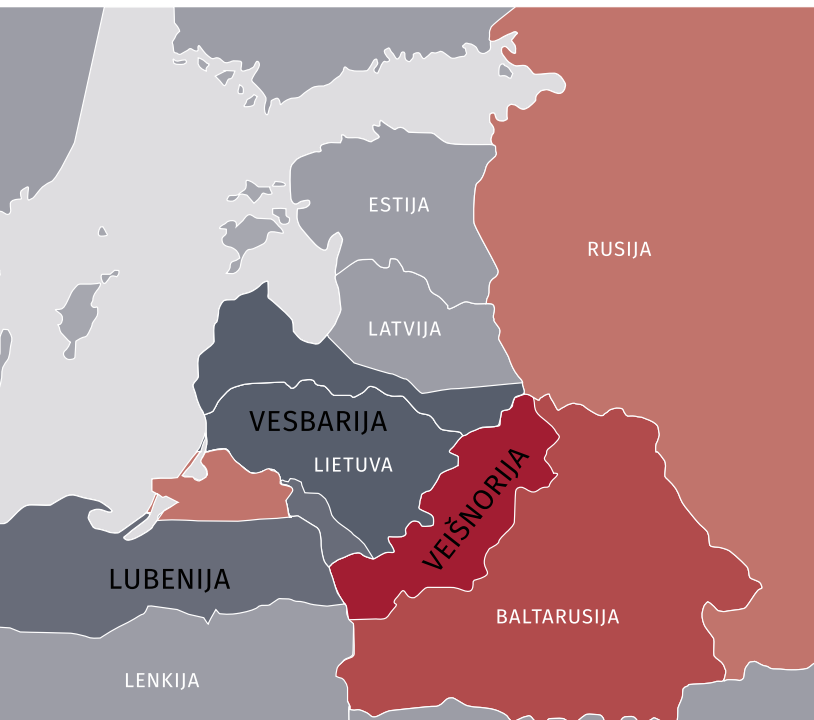
„Zapad 2017“ scenarijaus žemėlapis fragmentas

Rusijos karinio planavimo Vakarų kryptimi. Demonstruodama tariamą atvirumą, Baltarusija į mokymus pakvietė tarptautinius stebėtojus, žurnalistus ir akcentavo, kad pagrindiniai mokymų epizodai vyksta jos teritorijoje. Taip buvo siekiama nuslėpti tikrąjį Rusijos teritorijoje vykusių mokymų mastą. Be to, per įvairius su Baltarusijos valdžia susijusius asmenis stengtasi įteigti, kad buvo dveji mokymai „Zapad 2017“: agresyvūs rusiškieji ir „skaidrūs“ baltarusiškieji.