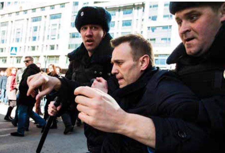
A. Navalno suėmimas per antikorporucinius protestus 2017 m.

cinių protestų banga parodė, kad šalies jaunimas nėra toks politiškai apatiškas kaip vyresnioji karta ir kad jis linkęs reikalauti sisteminių permainų šalies politiniame gyvenime. Jaunoji karta nepriima valdžios kartojamų teiginių apie šalies politinį stabilumą kaip savaiminę vertybę. Tikimybė, kad gyventojų protestai galėtų priversti valdantįjį režimą daryti struktūrines reformas, yra labai nedidelė.