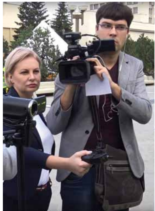
Rusijos propagandistai į Lietuvą rengti reportažų atvyksta slėpdami tikruosius savo vizitų motyvus

Kaip ir tikėtasi, per mokymus „Zapad 2017“ Baltijos šalys ir Lenkija vaizduotos kaip pagrindinės „paranojos“ Rusijos atžvilgiu skleidėjos, taip kuriant skirtį tarp „rusofobiškos“ stovyklos ir nuosaikiųjų Vakarų. Vis dėlto pažymėtina, kad priešiška komunikacinė tema buvo šalutinė. Esminės Rusijos strateginės komunikacijos pastangos buvo sutelktos ne į bauginimą, o į menamą skaidrumą ir atvirumą, taip bandant gerinti santykius su Vakarais.