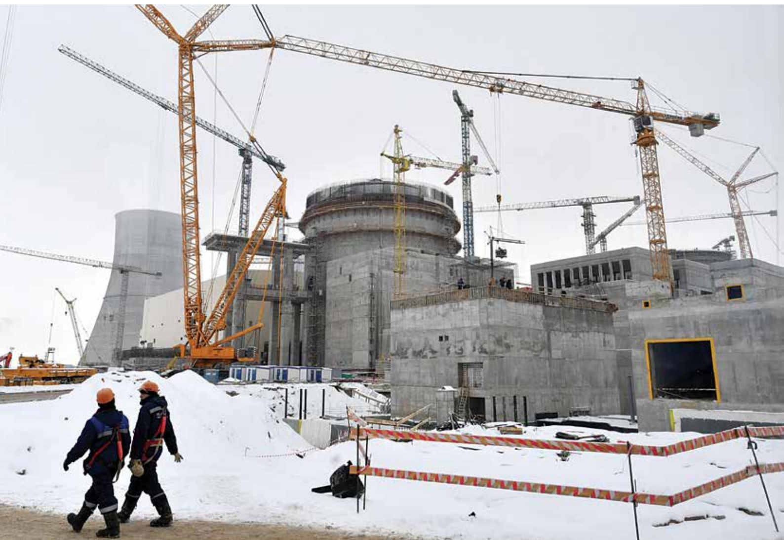
Astravo elektrinės statyba.