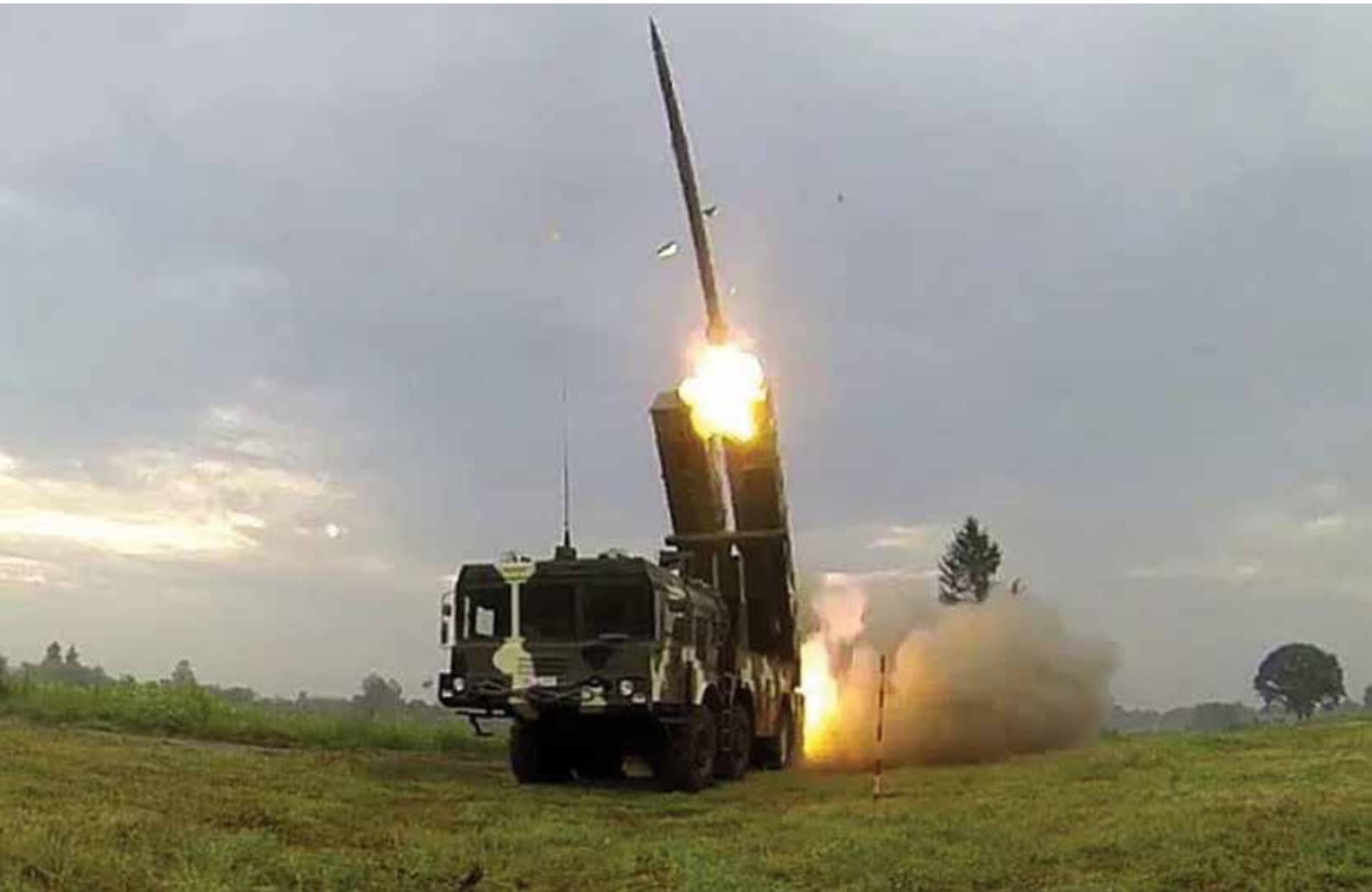
Reaktyvinė salvių ugnies sistema „Polonez“.