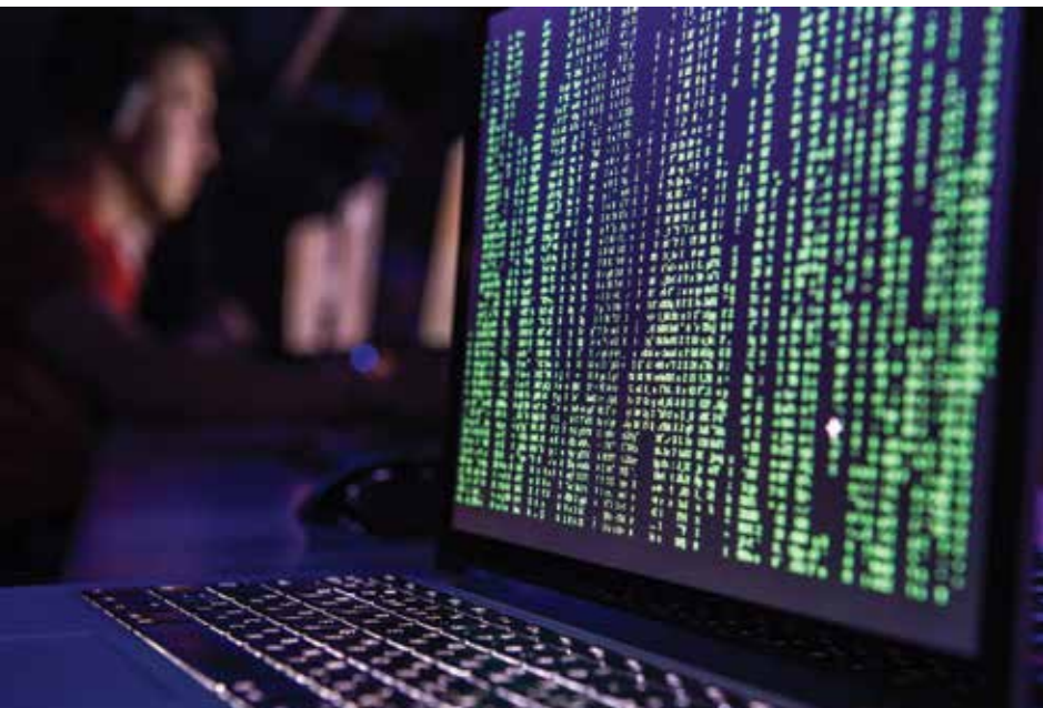
Kibernetinė ataka.

2017 m. JAV paviešino informaciją, kad APT28 / Sofacy 2016 m. įsilaužė į Demokratų partijos rinkimų štabo kompiuterius, taip pat atakavo JAV kompaniją, gaminančią rinkimų balsų skaičiavimo techninę ir programinę įrangą. Grupuotė taip pat įtariama 2017 m. nutekinusi tuometinio kandidato į Prancūzijos prezidentus Emmanuelio Macrono rinkimų kampanijos personalo elektroninius laiškus ir 2017 m. birželį bandžiusi trikdyti Juodkalnijos įstojimo į NATO procesą. Tikėtina, kad