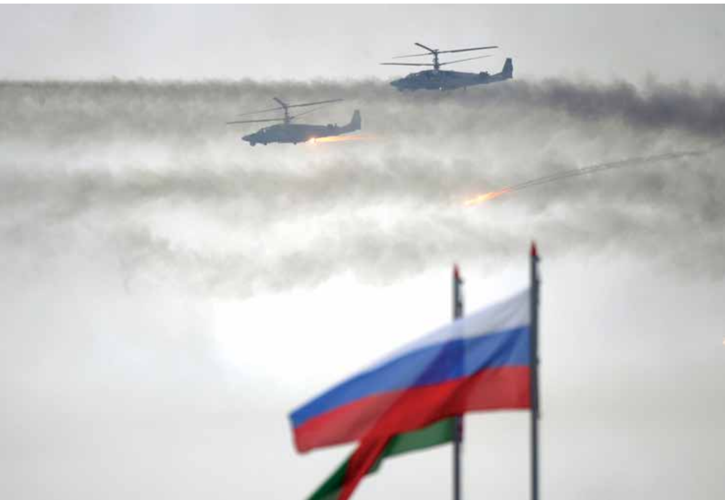
Bendri Rusijos–Baltarusijos mokymai „Zapad 2017“.

Rusija pateikė regiono valstybėms melagingus duomenis apie būsimų mokymų geografinę aprėptį, dalyvių skaičių ir scenarijų. Mokymų mastas ir kompleksškumas rodo, kad buvo vykdomi ne antiteroristiniai mokymai, o tikrinami operaciniai planai prieš Vakarų priešininką. Atskiri pratybų epizodai rodo, kad šiuose planuose yra puolamojo pobūdžio elementų. Puolamojo pobūdžio užduotys buvo vykdomos Baltarusijoje, Kaliningrado srityje ir likusioje Rusijos dalyje.