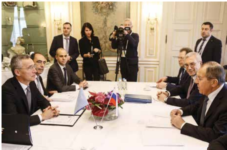
Rusijos ir NATO delegacijų susitikimas Miuncheno saugumo konferencijoje 2018 m.

2017 m. Rusija bandė santykiams su JAV ir Europos valstybėmis suteikti pozityvios dinamikos, o jos politinė vadovybė dažnai laikėsi nuosaikiau nei ankstesniais metais. Tai skatino artėjusių Rusijos prezidento rinkimų ir Rusijoje vykšančio Pasaulio futbolo čempionato veiksniai, prieš kuriuos siekta parodyti daugiau pozityvios dinamikos santykiuose su Vakarais. Kitas motyvas – Rusijos diplomatai santykinai nesėkmingi 2015–2016 m., kurie parodė, kad ligtinė aiškiai konfrontacinė elgsena daugeliu atvejų nepasiteisino. Nemažai vilčių Rusija siejo su rinkimais JAV, Prancūzijoje ir Vokietijoje, nes tikėjosi Vakarų valstybių laikysenos pokyčių. Pagrindinis Rusijos laikysenos korekcijos tikslas buvo siekis susilpninti sankcijų režimą, didinti įtaką procesams NATO ir Europos Sąjungoje (toliau – ES). Rusija stengėsi sukurti sąlygas atskiroms valstybėms intensyviai ryšius su Rusija ir taip skatinti bendrą NATO ir ES pozicijų jos atžvilgiu irimą.