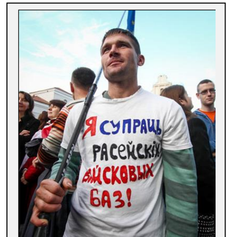
Didelė dalis Baltarusijos visuomenės nepritaria Rusijos bazės įkūrimui. Nuotraukoje – 2015 m. spalį Minske vykusios protesto akcijos dalyvis

Stiprėjanti dviejų valstybių karinė integracija didina Baltarusijos priklausomybę nuo Rusijos ir atitolina neutralios valstybės statuso siekiamą. Rusijos agresijos Ukrainoje metu padidėjus NATO kariniams pajėgumams Baltijos jūros regione, Rusija sustiprino Baltarusijos oro erdvės kontrolę, dislokuodama joje savo naikintuvus, o 2016 m. planuoja įkurti karinę aviacijos bazę. Baltarusija viešai kvestionuoja bazės dislokavimo būtinybę, tačiau išlaiko jai priimti skirtą infrastruktūrą. Įkūrus bazę Baltarusijos galimybės esant krizinei situacijai išlaikyti neutralumą sumažėtų iki minimumo. Rusija taip pat didina Baltarusijos ginkluotųjų pajėgų potencialą, tiekdamą naują ginkluotę ir karinę techniką. 2015 m. Baltarusijos karinės oro ir oro gynybos pajėgos gavo keturis mokomuosius-kovinius lėktuvus Jak-130 ir keturis zenitinių raketų kompleksus S-300. Šiais metais Baltarusiją turėtų pasiekti pirmieji nauji kariniai transporto sraigtasparniai Mi-8MTB-5 ir šarvuočiai BTR-82A.