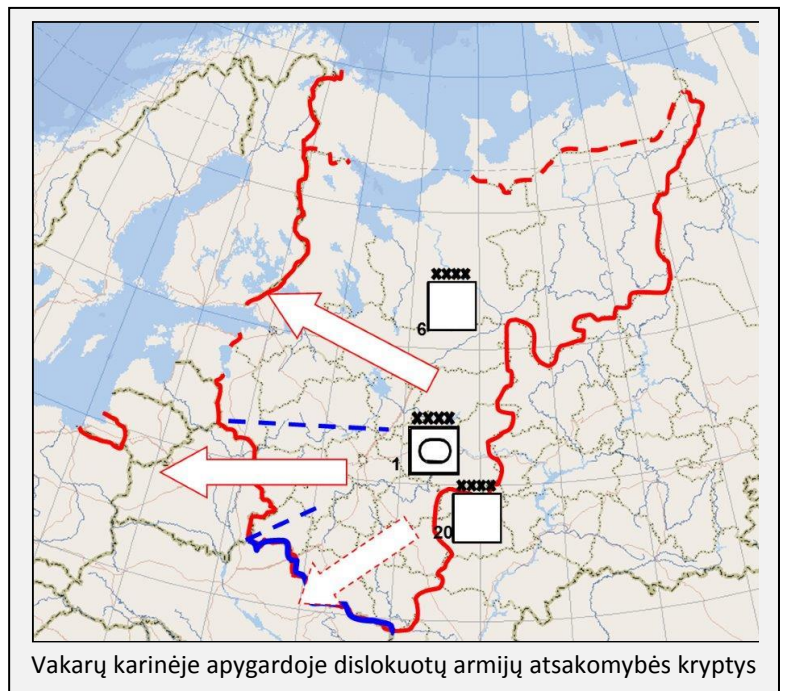
Vakarų karinėje apygardoje dislokuotų armijų atsakomybės kryptys

Rusijos operacinis planavimas šia kryptimi. Nors struktūriniai pokyčiai 20-ojoje armijoje dar tik pradėti, jau aiškėja, kad jai pavaldi liks 9-oji atskiroji motošaulių brigada, taip pat rezervo bazės