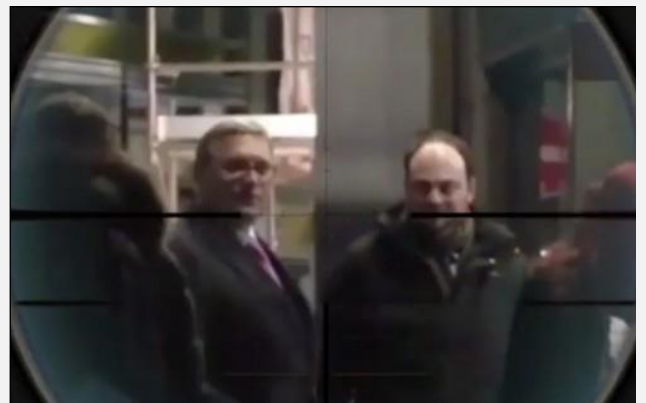
Čečėnijos vadovas Ramzanas Kadyrovas išplatino vaizdo įrašą, kuriame snajperinio ginklo taikiklyje matomi opozicijos atstovai Michailas Kasjanovas ir Vladimiras Kara-Murza jaunesnysis