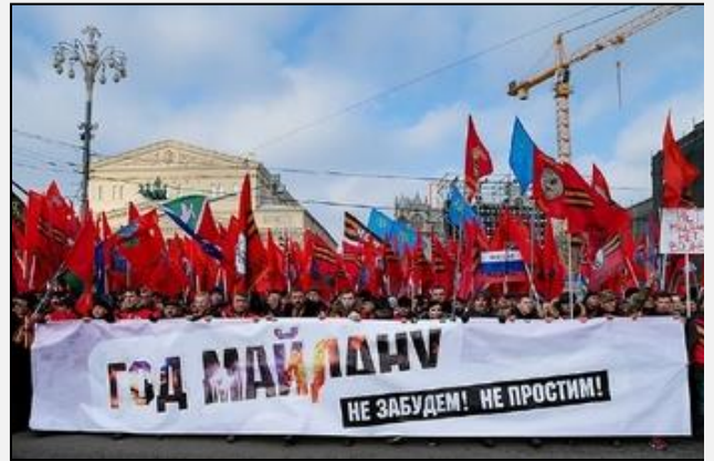
Šovinistinių ir prieš išorės priešus nukreiptų nuotaikų kurstymas Rusijos viešojoje erdvėje tęsiasi. Antiukrainietiška eisena Maskvoje 2015 m. vasarį

Rusijos užsienio politikos esminiai tikslai išlieka nepakitę: siekiama atkurti didžiosios galybės statusą, užsitikrinti vieną svarbiausių vaidmenų tarptautinėje politikoje ir visišką dominavimą posovietinėje erdvėje, kurią Rusija priskiria savo išskirtinių interesų sferai. Tai dar kartą aiškiai suformuluota 2015 m. gruodžio pabaigoje atnaujintoje Nacionalinio saugumo strategijoje. Iki tol galiojusioje strategijoje įrašytus Rusijos bendradarbiavimo su tarptautinėmis