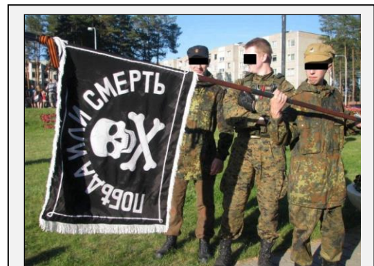
Šratasvydžio komandos „Ударный батальон смерти“ nariai, Visaginas, 2015 m.

Nors iki šiol Rusijos finansuojama veikla neišugdė daug Rusijai lojalių Lietuvos rusų jaunimo lyderių, galinčių daryti neigiamą įtaką Lietuvoje vykstantiems visuomeniniams procesams, Lietuvos tautinių