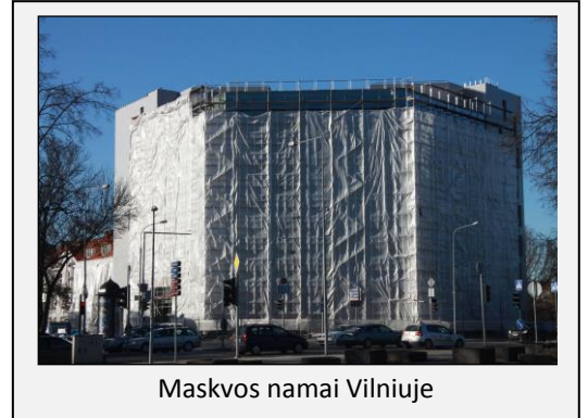
Maskvos namai Vilniuje

Įgyvendinant Rusijos tėvynainių politiką nemažą vaidmenį atlieka Maskvos ir Sankt Peterburgo miestų valdžios institucijos. Maskvos miesto vyriausybės Tarptautinių ir išorės ekonominių ryšių departamentas kuruoja užsienio valstybių sostinėse veikiančių Maskvos kultūros ir verslo centrų – Maskvos namų – tinklą, kuris yra viena iš svarbesnių Rusijos priemonių finansuojant ir koordinuojant užsienyje gyvenančius tėvynainius. Maskvos namų projekto įgyvendinimu Vilniuje aktyviai rūpinasi Rusijos ambasada.