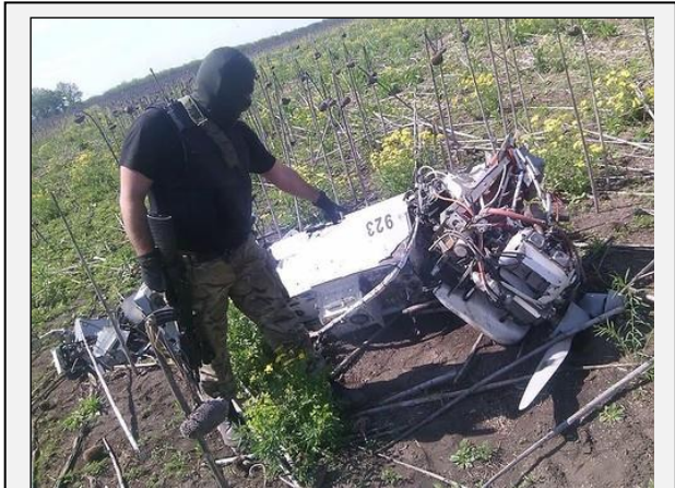
Bepilotis orlaivis „Forpost“, numuštas Rytų Ukrainoje. Orlaivį naudoja tik Rusijos ginkluotosios pajėgos. Donecko sritis, 2015 m. gegužė

Moldovoje 2014 m. pabaigoje kilusi bankų sektoriaus krizė 2015 m. virto gilia politine krize. Vyriausybės formavimo iniciatyvą išlaikė proeuropietiškos partijos, tačiau visuomenėje stiprėja alternatyvos valdančiajai koalicijai poreikis. 2015 m. antivyriausybines protesto akcijos padėjo iškilti naujiems proeuropietiškiems politikams, bet šiuo metu jie dar negali konkuruoti su