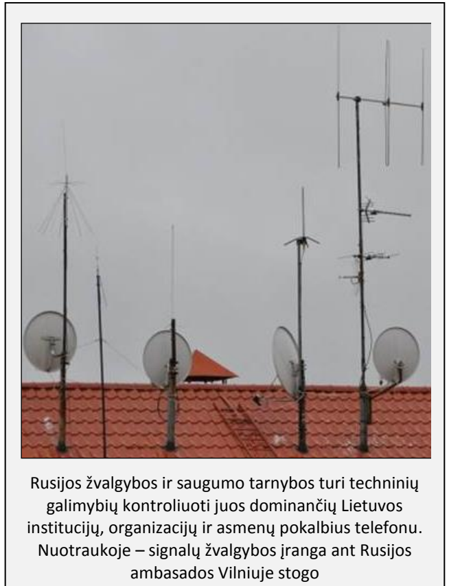
Rusijos žvalgybos ir saugumo tarnybos turi techninių galimybių kontroliuoti juos dominančių Lietuvos institucijų, organizacijų ir asmenų pokalbius telefonu. Nuotraukoje – signalų žvalgybos įranga ant Rusijos ambasados Vilniuje stogo

2015 m. rudenį vyko Baltarusijos prezidento rinkimai, todėl KGB stiprina Lietuvoje veikiančių Baltarusijos opozicijos atstovų kontrolę. Pagrindinė KGB užduotis buvo sutrukdyti opozicionieriams laikytis vieningos politikos per prezidento rinkimus. Baltarusijos slaptosios tarnybos, rinkdamos informaciją apie Lietuvoje veikiančias Baltarusijos opozicijos organizacijas, verbuoja Lietuvos baltarusių bendruomenės narius ir mūsų šalyje gyvenančius Baltarusijos piliečius. KGB taip pat mėgina infiltruoti agentus į Baltarusijos opozicijos organizacijas ir skatina juos dalyvauti opozicijos renginiuose Lietuvoje. Pagrindinis KGB tikslas verbuojant informacijos šaltinius ir įtakos agentus opozicijos organizacijose yra išlaikyti Baltarusijos opoziciją suskaldytą, neleisti, kad ji taptų realia politine alternatyva dabartinei Baltarusijos valdžiai.