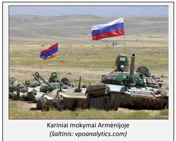
Kariniai mokymai Armėnijoje

Karinis konfliktas dėl Kalnų Karabacho ir aplink jį Armėnijos okupuotų septynių Azerbaidžano administracinių rajonų išlieka santykinai nedidelio intensyvumo, nors nemaža abiejų šalių karinių pajėgų dalis dislokuota konflikto zonoje, o nuo 2014 m. antrosios pusės vyksta epizodiniai suaktyvėjimai panaudojant sunkiąją ginkluotę. Konfliktuojančios pusės formaliai palaiko ryšius, tačiau nėra linkusios ieškoti kompromisų, galinčių padėti siekti progreso bandant sureguliuoti konfliktą. Armėnija ir ypač Azerbaidžanas išlaiko labai griežtą retoriką ir sparčiai vykdo ginkluotųjų pajėgų stiprinimo / modernizavimo programas. Apčiuopiamų rezultatų ilgą laiką neduodantis politinis sureguliuojimo procesas didina plataus masto karinio konflikto atsinaujinimo tikimybę, o Rusijos karinės technikos tiekimas abiem konfliktuojančioms šalims didina regiono nestabilumą ir galimo karinio konflikto mastą.